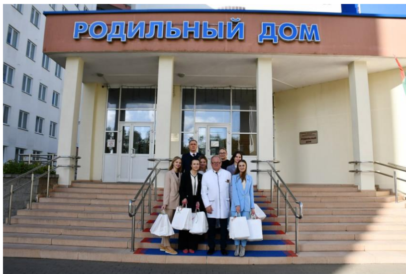
Праздничная акция ко Дню матери

В фокусе внимания союза — поиск конструктивно настроенных представителей женского движения зарубежных стран, установление неформальных контактов, практическая реализация подписанных соглашений.