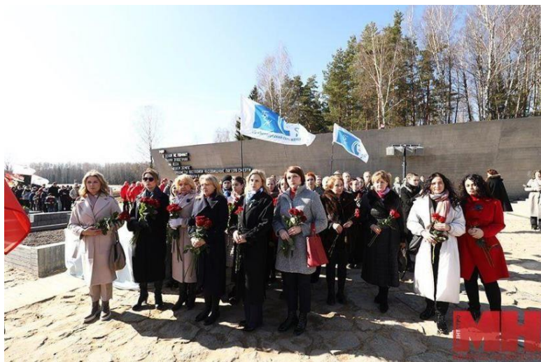
Делегация БСЖ возлагает цветы в Государственном мемориальном комплексе «Хатынь»

Таким стал финал трогательной акции «Огонь памяти», организованной БСЖ.