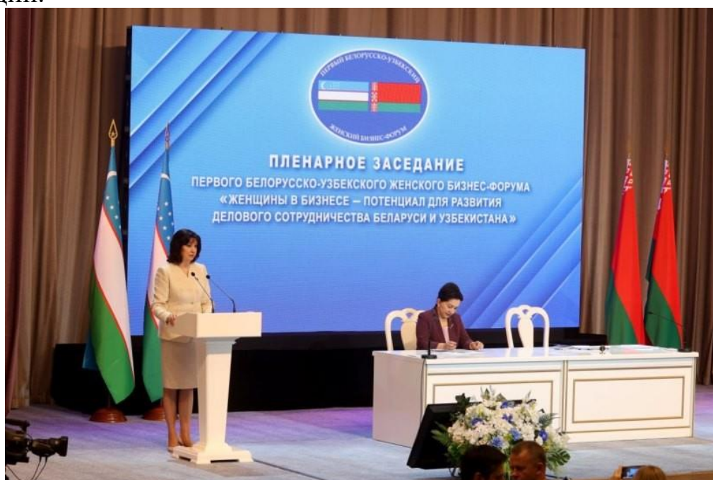
Пленарное заседание первого белорусско-узбекского женского бизнес-форума

В Декларации содержится общая позиция по актуальным проблемам, с которыми всем женщинам приходится сталкиваться в современном мире, закреплены подходы к дальнейшему развитию двустороннего партнерства, в том числе в сфере реализации прав и возможностей женщин.