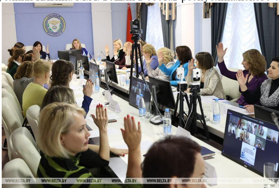
Заседание правления ОО «БСЖ» 21 марта 2023 г.

Председатель Совета Республики Кочанова Н.И. и член Совета Республики Ильина М.А. вошли в состав республиканского союза.