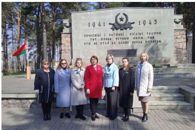
Члены первичной организации БСЖ Совета Республики возложили цветы к мемориальному комплексу «Масюковщина»