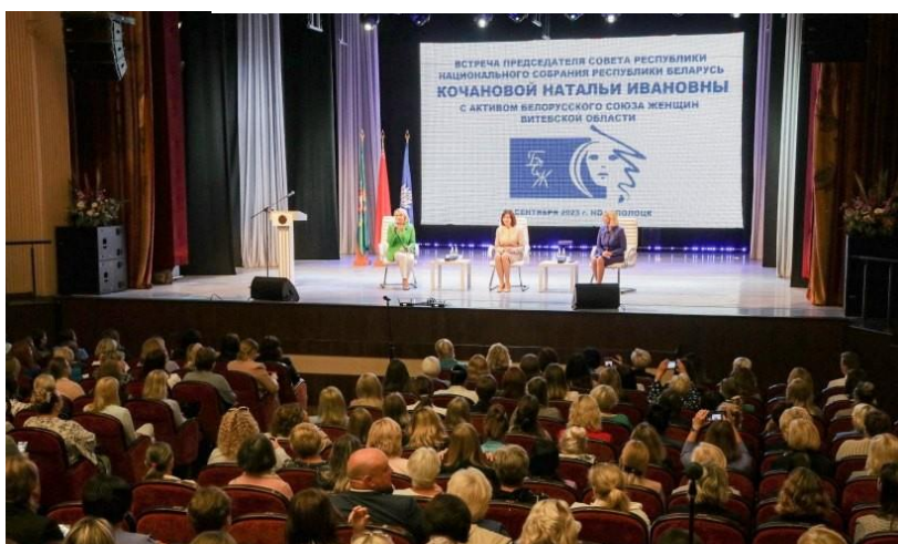
Встреча с активом БСЖ Витебской области