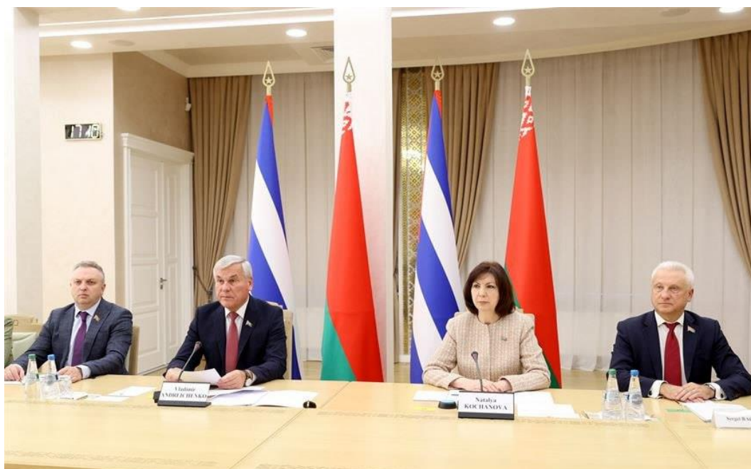
Встреча руководства Национального собрания Республики Беларусь с Председателем Национальной ассамблеи народной власти Республики Куба Хуаном Эстебаном Ласо Эрнандесом

Просьба о содействии развитию сотрудничества между этими организациями озвучена Председателем Совета Республики Кочановой Н.И. в ходе встречи руководства Национального собрания Республики Беларусь с Председателем Национальной ассамблеи народной власти Республики Куба Хуаном Эстебаном Ласо Эрнандесом в режиме видео-конференц-связи 19 октября 2023 г.