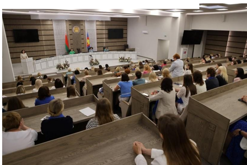
Председатель Совета Республики Наталья Кочанова вводит встречу с женским активом Брестской области