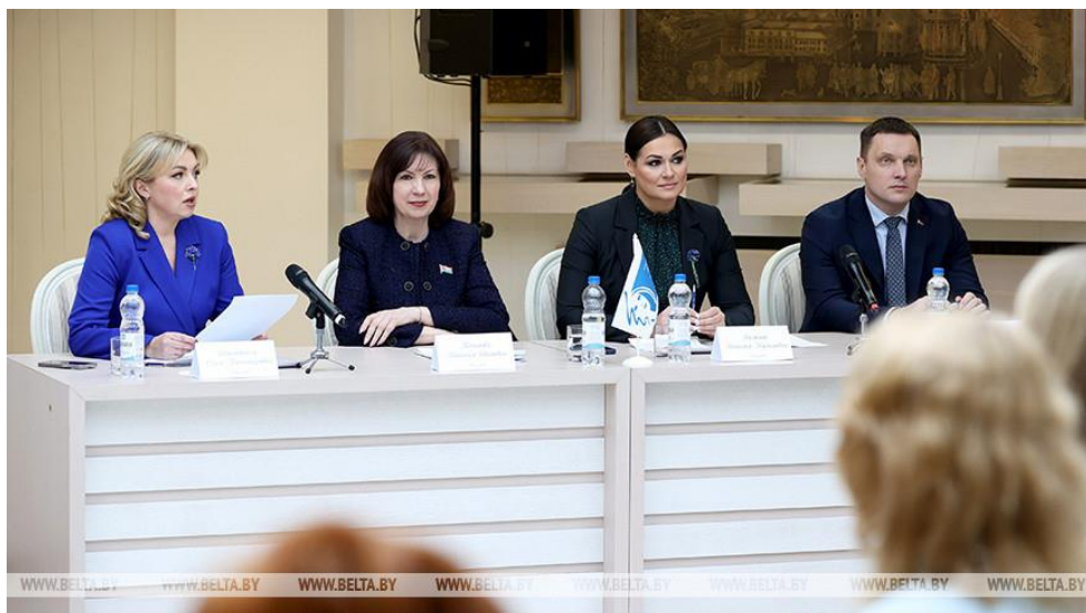
VIII Республиканская отчетно-выборная конференция БСЖ

3 марта Председатель Совета Республики Кочанова Н.И. приняла участие в VIII Республиканской отчетно-выборной конференции Белорусского союза женщин.