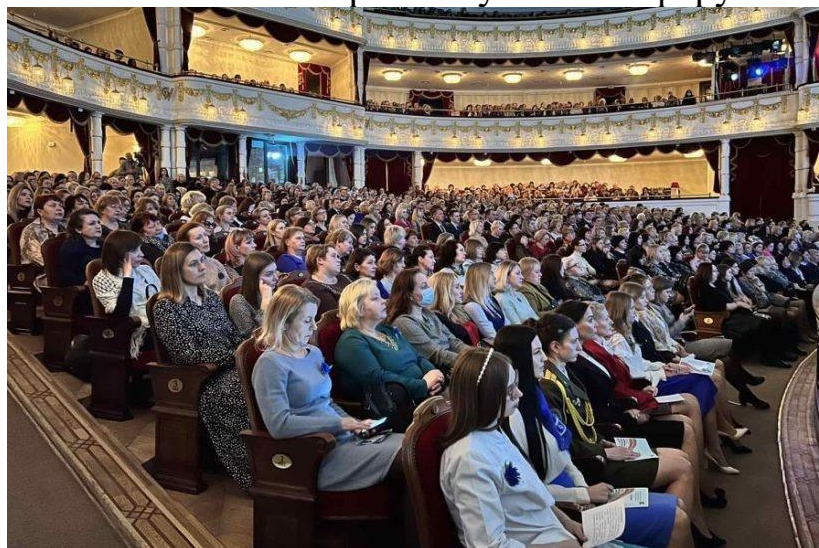
Женский форум «Сохраняем историческую память. Создаем новейшую историю страны»

В защиту суверенитета Беларуси проведен масштабный женский форум «Сохраняем историческую память. Создаем новейшую историю страны», приуроченный ко Дню Конституции Беларуси. Председатель Совета Республики Н.Кочанова приняла участие в форуме 14 марта.