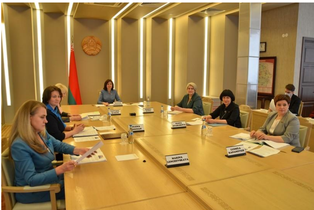
Онлайн-семинар женщин-парламентариев Беларуси и Китая

В повестке дня семинара — актуальные вопросы: роль женщин-парламентариев в государственном управлении и содействии экономическому и социальному развитию, защита прав и интересов женщин, укрепление международного взаимодействия, профилактика и лечение ковид.