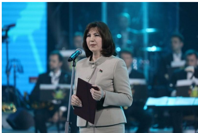
Н.Кочанова принимает участие в Форуме «Мир в руках женщины»

Спикер Совета Республики зачитала приветственный адрес от имени Главы государства на форуме.