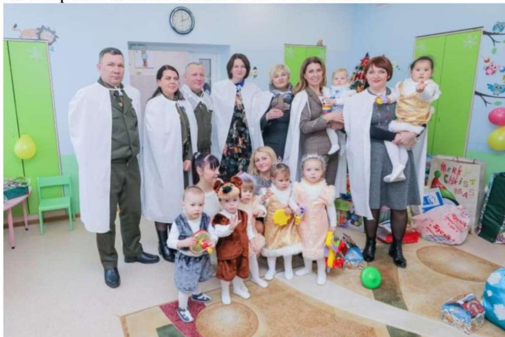
Новогодний утренник в Доме ребенка ИУ «ИК № 4», 30.12.2021

Первичная организация БСЖ приняла участие в акции «Наши дети», посетив Детский городок Ленинского района Минска и дом ребенка исправительной колонии № 4 в Гомеле.