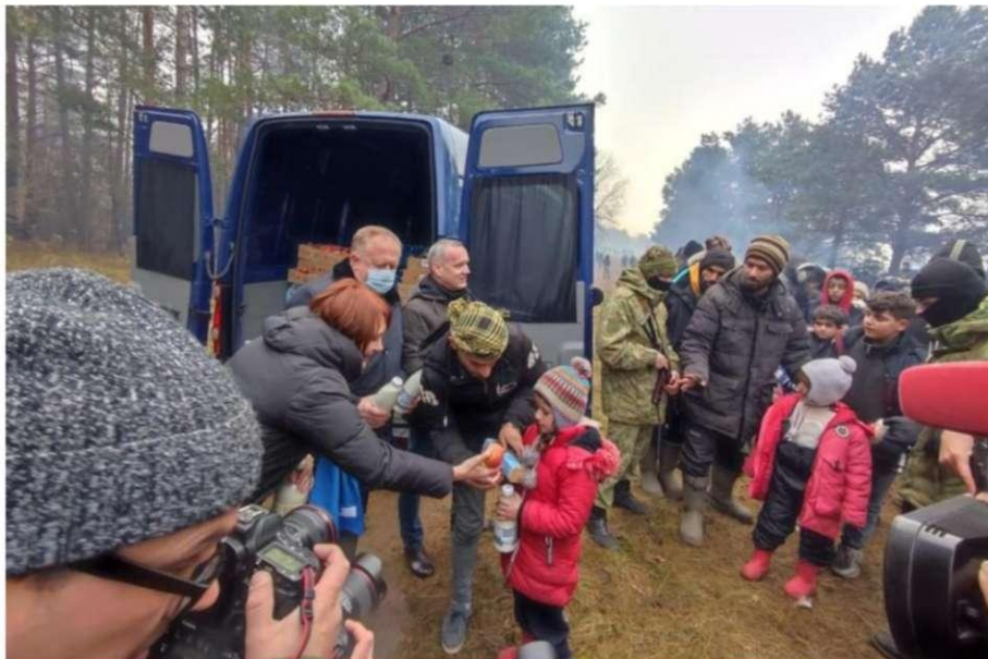
Выдача гуманитарной помощи беженцам на границе, 09.11.2021

Члены первичной организации БСЖ одними из первых отреагировали на ситуацию с мигрантами на границе Беларуси и ЕС.