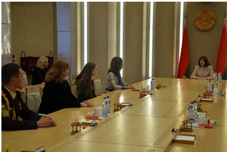
Встреча Н.И.Кочановой с активистками Союза женщин МВД и их детьми, 17.09.2021

Спикер познакомилась с женщинами, которые проживают в общежитии для совместного проживания осужденных-матерей с детьми, пообщалась с девушками, попавшими в учреждение, будучи несовершеннолетними, уделила время и самым маленьким в Доме ребенка.