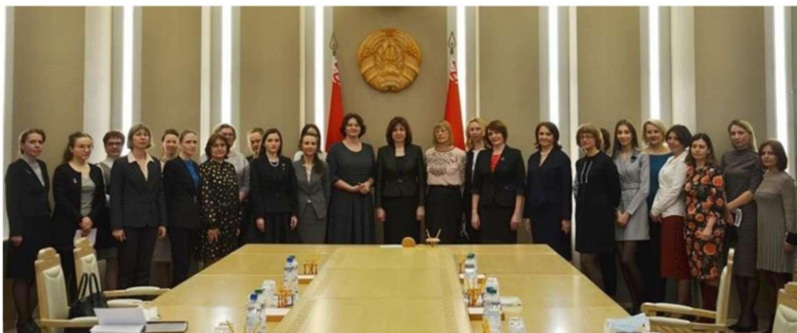
Собрание женского актива Совета Республики и его Секретариата. 31.12.2020

В канун 2021 года в Совете Республики прошло собрание женского актива, где принято решение о создании первичной организации общественного объединения «Белорусский союз женщин».