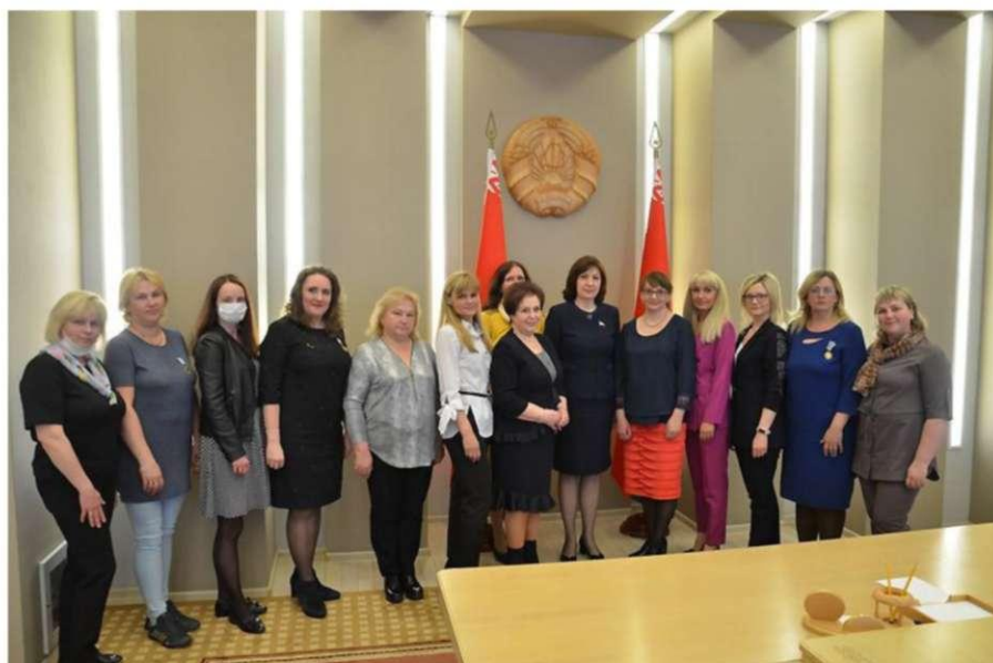
Встреча Н.И.Кочановой с членами Белорусской ассоциации многодетных родителей, 15.05.2021

БСЖ выработывал предложения по совершенствованию механизма государственной поддержки семей с детьми — проведена диалоговая площадка с активом Белорусской ассоциации многодетных родителей в Совете Республики.