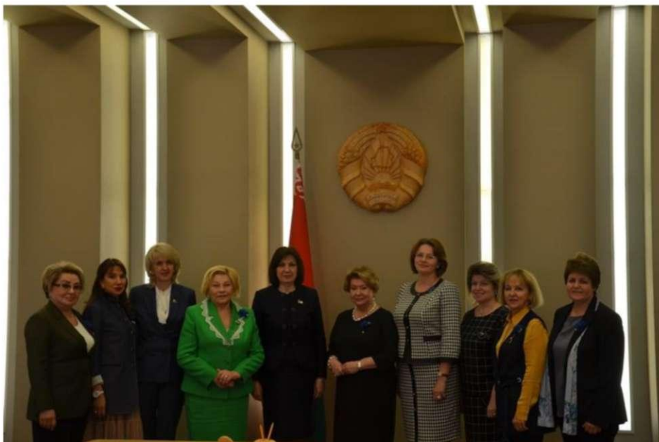
Встреча Н.И.Кочановой с делегацией Союза женщин России, 01.10.2021

Инициативы по активизации белорусско-российской женской повестки дня обсуждены 1 октября 2021 г. в Совете Республики на встрече Председателя Совета Республики Национального собрания Республики Беларусь Кочановой Н.И. с делегацией Союза женщин России.