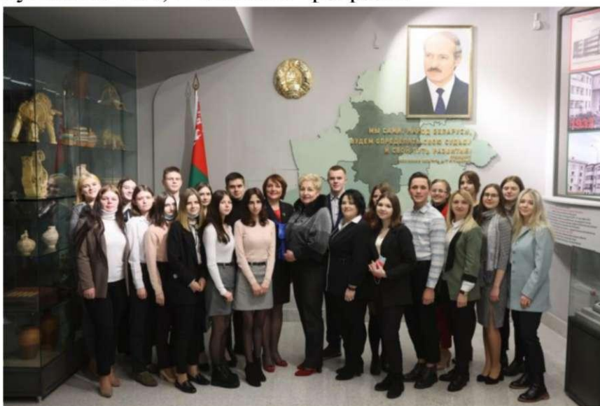
Посещение учащимися Полоцкого колледжа УО "Витебский государственный университет имени П.М. Машерова" Совета Республики, 05.02.2021