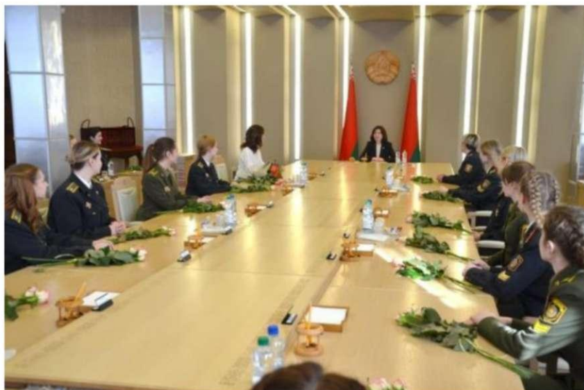
Встреча Н.И.Кочановой с курсантками Академии МВД, 05.03.2021

В честь Дня милиции и Международного женского дня 8 марта Совет Республики посетили курсантки Академии МВД и Могилевского института МВД.