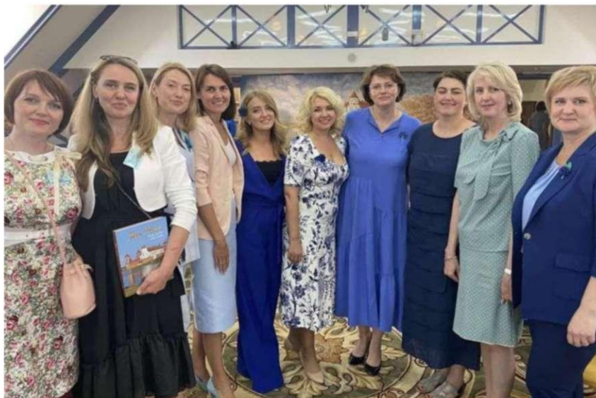
Конкурс молодежных проектов БСЖ «Дзявочы вянок Міра», 07.07.2021