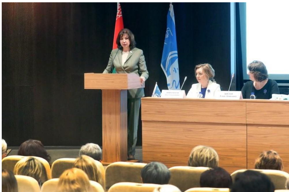
Н.Кочанова участвует в заседании правления БСЖ

В условиях санкционной политики и внешнего давления БСЖ представляет собой серьезный ресурс «мягкой силы» — народной и общественной дипломатии.