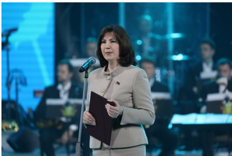
Н.Кочанова принимает участие в Форуме «Мир в руках женщины»

Спикер Совета Республики зачитала приветственный адрес от имени Главы государства на форуме.