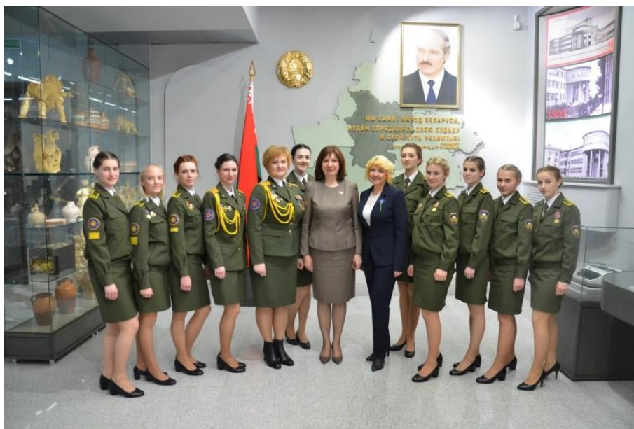
Встреча Н.Кочановой с девушками-курсантами УО «Университет гражданской защиты Министерства по чрезвычайным ситуациям Республики Беларусь» — членами молодежного крыла союза женщин МЧС

Ключевым элементом мероприятия стала встреча с Председателем Совета Республики Натальей Кочановой в формате диалоговой площадки. Каждый мог высказать свое мнение, адресовать Председателю Совета Республики вопросы и главное — получить на них исчерпывающие ответы.