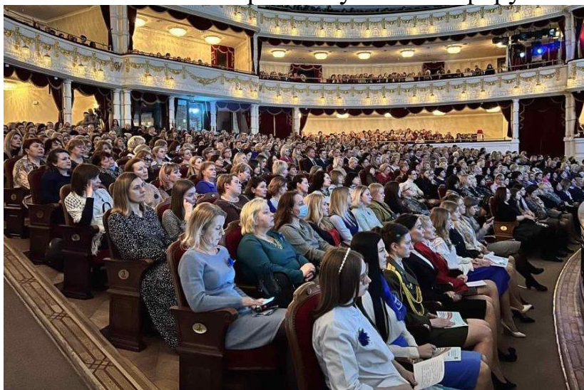
Женский форум «Сохраняем историческую память. Создаем новейшую историю страны»

В защиту суверенитета Беларуси проведен масштабный женский форум «Сохраняем историческую память. Создаем новейшую историю страны», приуроченный ко Дню Конституции Беларуси. Председатель Совета Республики Н.Кочанова приняла участие в форуме 14 марта.