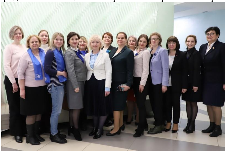
Заседание круглого стола на тему профилактики и современных подходов в диагностике, лечении онкозаболеваний в рамках республиканской акции БСЖ «Здоровье женщины — здоровье нации»

Обсуждены актуальные проблемы, связанные с онкологическими заболеваниями, выявляемыми у женщин, методами их решения в части диагностики, лечения, профилактики, а также популяризация успешного опыта работы отечественных онкологов. В онлайн-режиме подключились более 100 представительниц БСЖ из различных регионов страны.