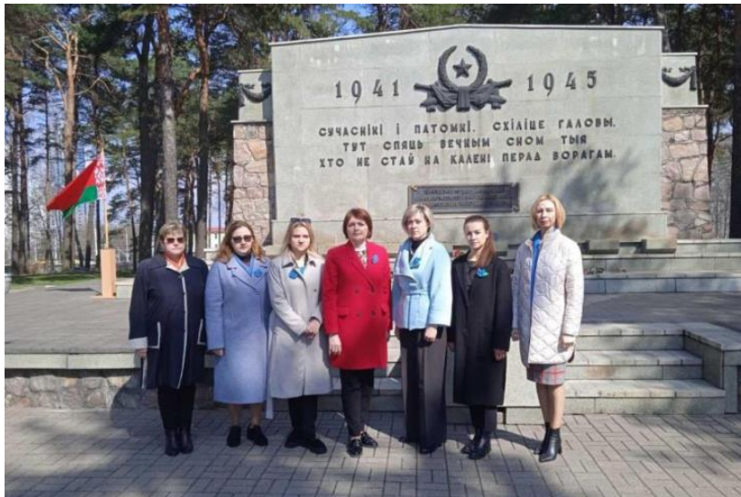
Члены первичной организации БСЖ Совета Республики возложили цветы к мемориальному комплексу «Масюковщина»