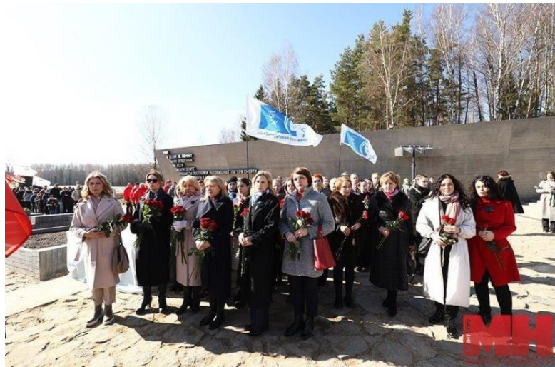
Делегация БСЖ возлагает цветы в Государственном мемориальном комплексе «Хатынь»

Таким стал финал трогательной акции «Огонь памяти», организованной БСЖ.