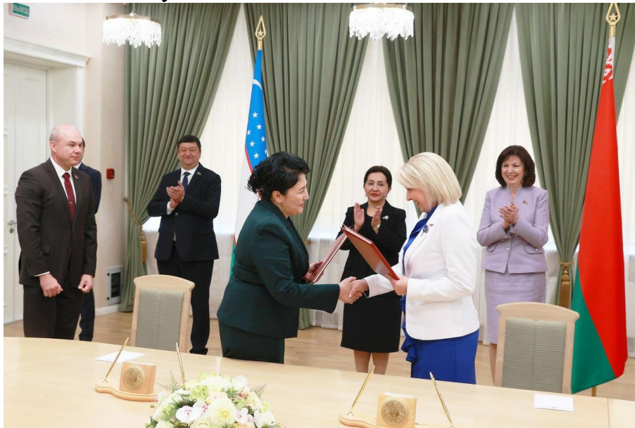
Церемония подписания Меморандума о сотрудничестве между общественным объединением «Белорусский союз женщин» и Комитетом семьи и женщин Республики Узбекистан

5 сентября 2023 г. в Совете Республики Национального собрания Республики Беларусь в рамках мероприятий официального визита парламентской делегации Республики Узбекистан во главе с Председателем Сената Олий Мажлиса Республики Узбекистан Нарбаевой Т.К. и мероприятий первого белорусско-узбекского женского бизнес-форума подписан Меморандум о сотрудничестве между общественным объединением «Белорусский союз женщин» и Комитетом семьи и женщин Республики Узбекистан при Министерстве занятости и сокращения бедности Республики Узбекистан.