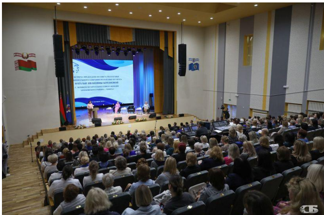
Встреча с активом БСЖ Московского района города Минска

представительницами Белорусского союза женщин Гомельской области, 14 сентября — встреча с активом БСЖ Витебской области, 29 сентября 2023 г. Председатель Совета Республики Наталья Кочанова провела встречу с активом Белорусского союза женщин Московского района города Минска, 20 октября — с активом Белорусского союза женщин Могилевской области в г. Могилеве.