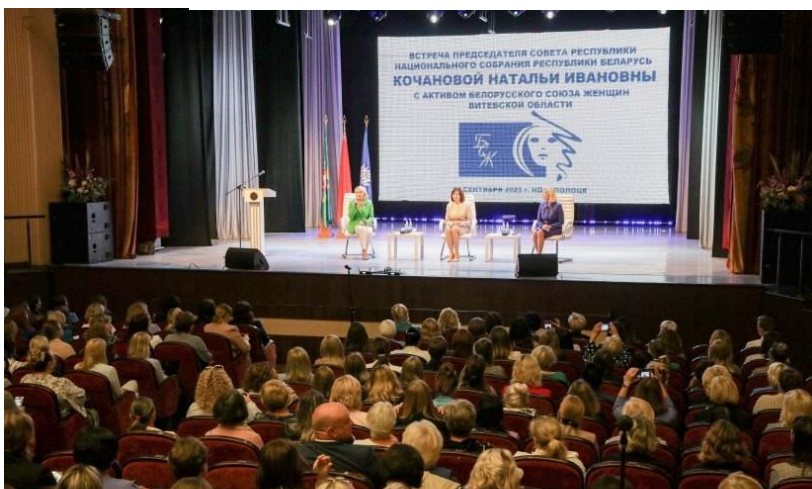
Встреча с активом БСЖ Витебской области