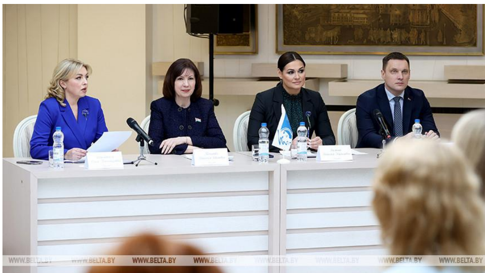
VIII Республиканская отчетно-выборная конференция БСЖ

3 марта Председатель Совета Республики Кочанова Н.И. приняла участие в VIII Республиканской отчетно-выборной конференции Белорусского союза женщин.