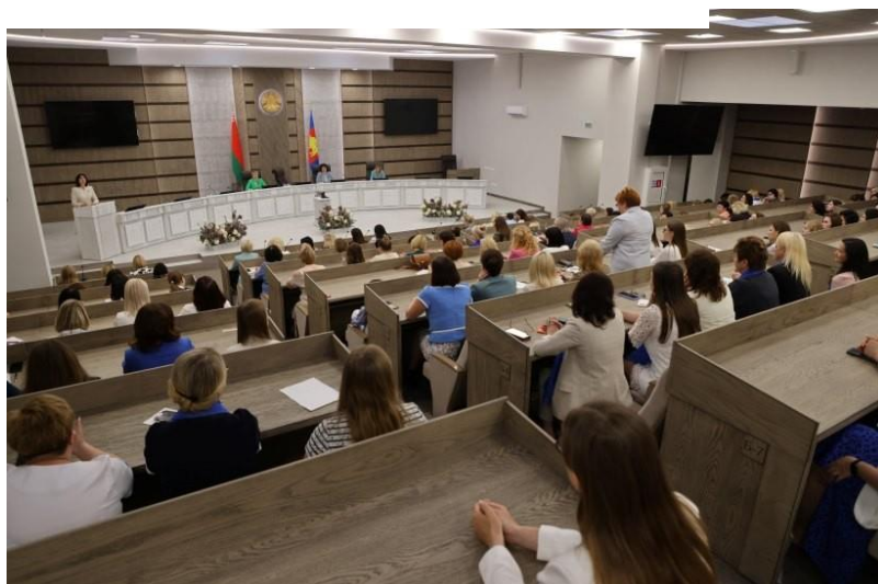
Председатель Совета Республики Наталья Кочанова проводит встречу с женским активом Брестской области