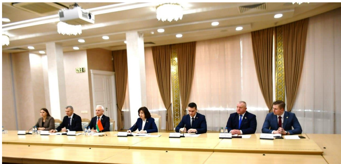
Заседание круглого стола по вопросам молодежной политики Беларуси и Китая

Стороны активно реализуют этот документ, обмениваются опытом. Председатель Белорусского союза женщин в марте 2023 г. посетила Пекин для участия в Международном симпозиуме по вопросам образования девочек и женщин. Прошли встречи с руководством Всекитайской федерации женщин и Шанхайской федерации женщин.