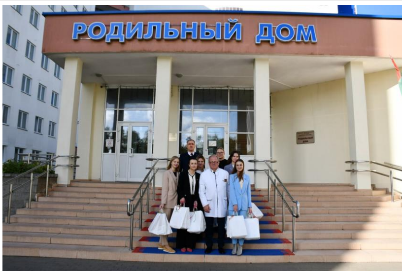
Праздничная акция ко Дню матери

В фокусе внимания союза — поиск конструктивно настроенных представителей женского движения зарубежных стран, установление неформальных контактов, практическая реализация подписанных соглашений.