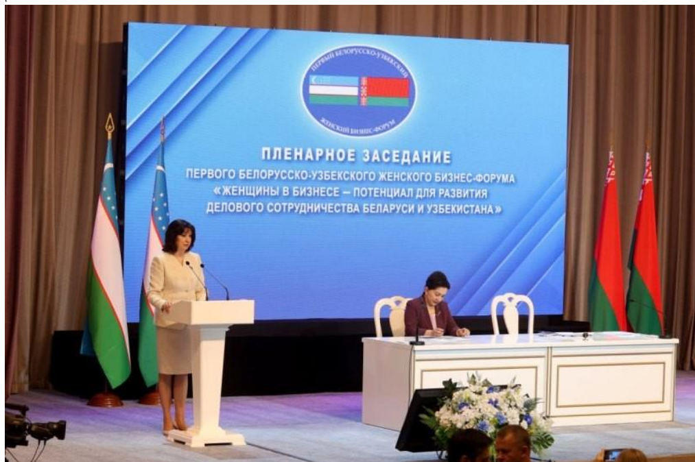
Пленарное заседание первого белорусско-узбекского женского бизнес-форума

В Декларации содержится общая позиция по актуальным проблемам, с которыми всем женщинам приходится сталкиваться в современном мире, закреплены подходы к дальнейшему развитию двустороннего партнерства, в том числе в сфере реализации прав и возможностей женщин.