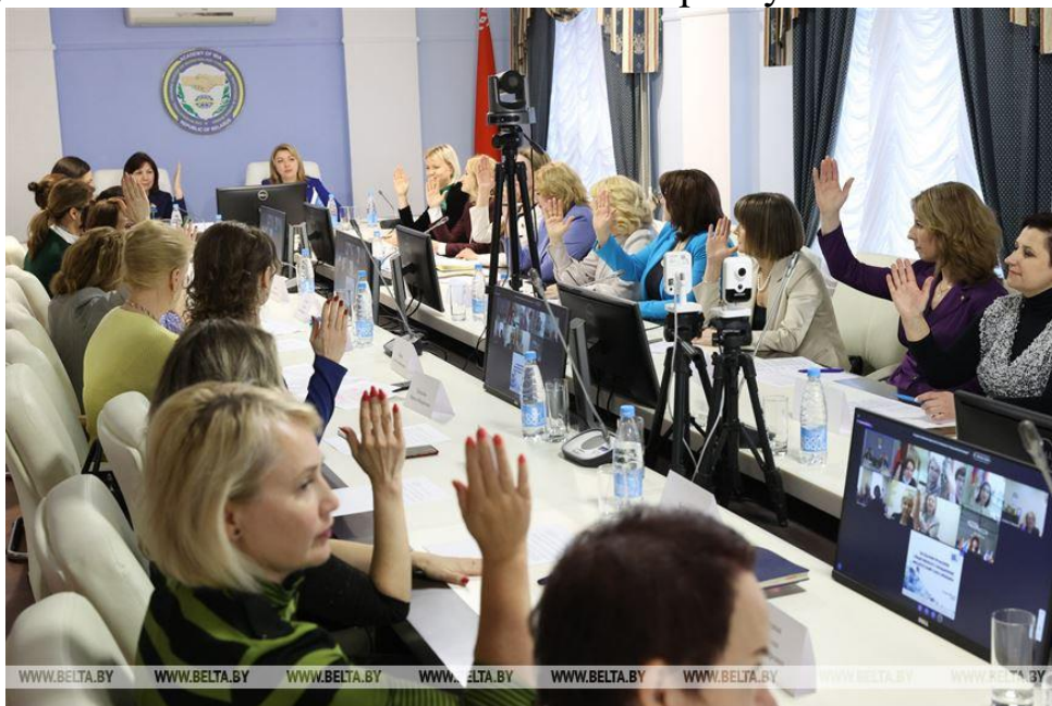
Заседание правления ОО «БСЖ» 21 марта 2023 г.

Председатель Совета Республики Кочанова Н.И. и член Совета Республики Ильина М.А. вошли в состав республиканского союза.