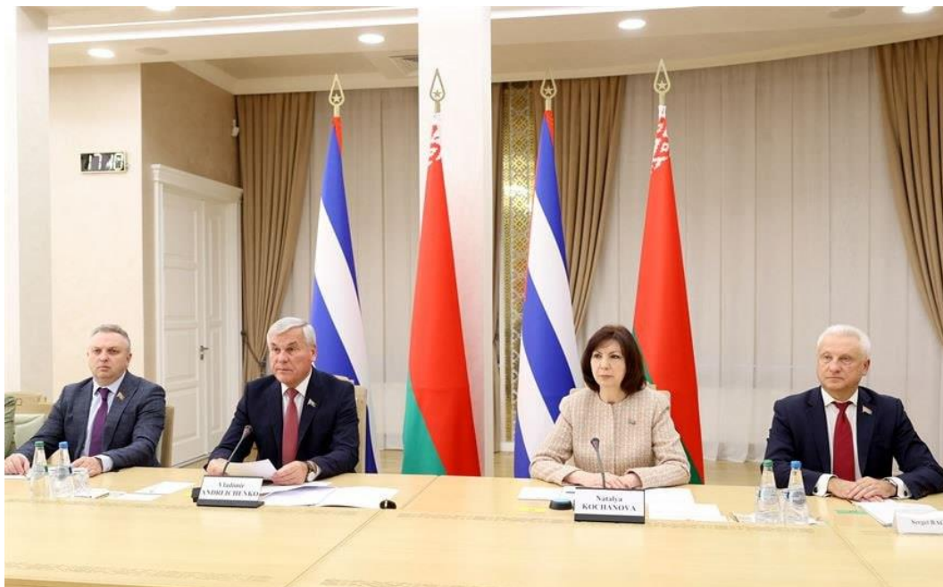
Встреча руководства Национального собрания Республики Беларусь с Председателем Национальной ассамблеи народной власти Республики Куба Хуаном Эстебаном Ласо Эрнандесом

Просьба о содействии развитию сотрудничества между этими организациями озвучена Председателем Совета Республики Кочановой Н.И. в ходе встречи руководства Национального собрания Республики Беларусь с Председателем Национальной ассамблеи народной власти Республики Куба Хуаном Эстебаном Ласо Эрнандесом в режиме видео-конференц-связи 19 октября 2023 г.